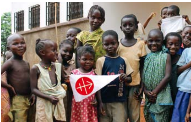
Ich przyszłość jest naszą przyszłością – te dzieci z Republiki Środkowoafrykańskiej mówią „dziękuję“.

Wzrost liczby próśb o pomoc z Afryki odzwierciedla wzrost Kościoła na tym kontynencie. Z Afryki dociera do nas już 34 % ogólnej liczby wniosków. Szczególną uwagę poświęcamy krajom strefy Sahelu, północnej Nigerii, Kenii, Tanzanii i Madagaskarowi – krajom, w których szerzy się agresywny islam. Na Bliskim Wschodzie, w kolebce chrześcijaństwa, najwięcej kosztuje pomoc doraźna i podstawowa pomoc materialna. Dzięki niej umożliwiamy wyznawcom Chrystusa pozostanie w regionie. W Azji Kościół potrzebuje pomocy nie tylko w krajach uciskanych przez dyktatury komunistyczne – w Chinach, Wietnamie i Laosie – lecz także coraz częściej tam, gdzie chrześcijanom zagraża radykalny hinduizm lub islam, na przykład w Indiach i Pakistanie, a nawet w części Filipin. W Europie Środkowej i Wschodniej punkt ciężkości pomocy przesuwają się od projektów budowlanych ku wsparciu formacji i edukacji. W centrum naszego zainteresowania w tym regionie są zwłaszcza kraje bałkańskie, gdzie chrześcijanom także utrudniają życie radykalne nurty islamu. Nasza solidarność pomaga również tamtejszym chrześcijanom mężnie trwać w wierze.